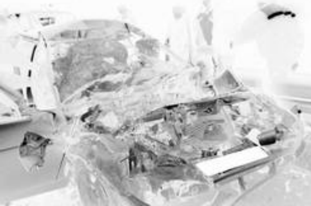
На 41-ом километре автодороги Павловка - Старая Кулатка 22 октября 2016 года зарегистрировано ДТП со смертельным исходом. Погиб пассажир автомобиля марки

«Калина», жительница р.п. Павловка. Получившие различные травмы пассажиры доставлены в лечебные учреждения. Водитель автомобиля «BYD F3» нарушил правила расположения транспортных средств на проезжей части и допустил лобовое столкновение с двигавшимся на встречном направлении автомобилем Калина. Уважаемые водители, будьте бдительны и не нарушайте ПДД РФ!